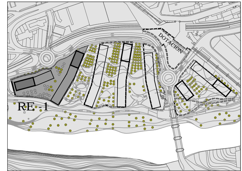
⌚ KOKAPENA / SITUACION