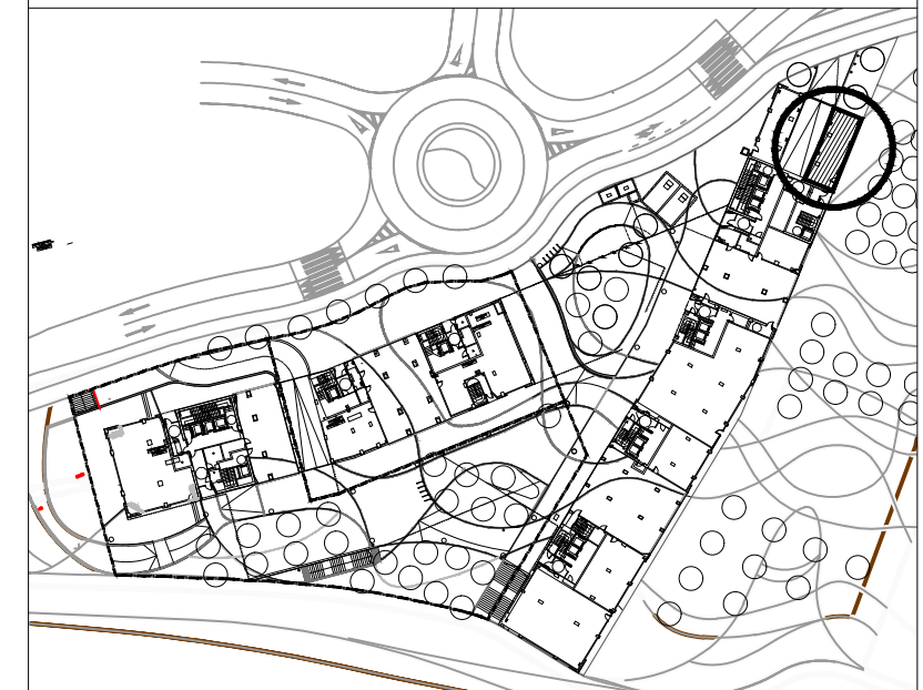
BEHEKO SOLAIRUA / PLANTA BAJA