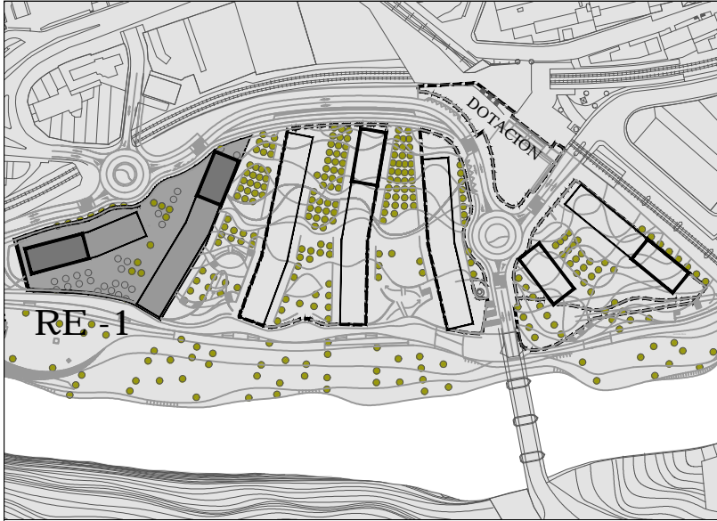
⌚ KOKAPENA / SITUACION

NOTA: EL TRAZADO DE CANALIZACIONES Y LA SITUACIÓN DE ELEMENTOS DE INSTALACIONES SON APROXIMADAS OHARRA: KANALIZAZIOEN TRAZADURA ETA INSTALAZIO ELEMENTUEN KOKAPENA GUTXIGORABEHERAKOAK DIRA