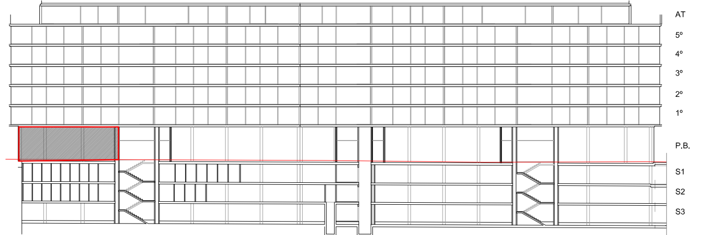
SECCION / SEKZIO

OHARRA: INFORMAZIO HAU ADIERAZTE HUTSEKOA DA, ERAIKUNTZAREN LANEAN ALDAKETAK EGON DAITEZKE. SEGURTASUN ARRASOIENGATIK DEBEKATUTA DAGO OBRAN SARTZEA. NOTA: ESTA INFORMACION ES INDICATIVA, ESTANDO SUJETA A MODIFICACIONES EN EL DESARROLLO DE LA OBRA. POR RAZONES DE SEGURIDAD NO SE PERMITE EL ACCESO A LA OBRA.