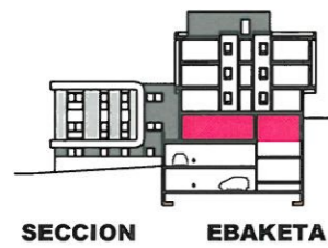
SOTANO 1 LEHENENGO SOTOA LOCAL / LOKALA